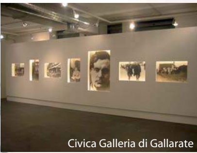
Civica Galleria di Gallarate